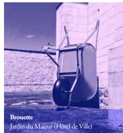
Brouette Jardin du Maître (Hôtel de Ville)