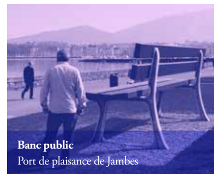
Banc public Port de plaisance de Jambes

Ses sculptures attirent par leur aspect résolument ludique, alors que, dans le même temps, elles sèment la confusion et brouillent les repères en perturbant nos usages et notre rapport au réel.