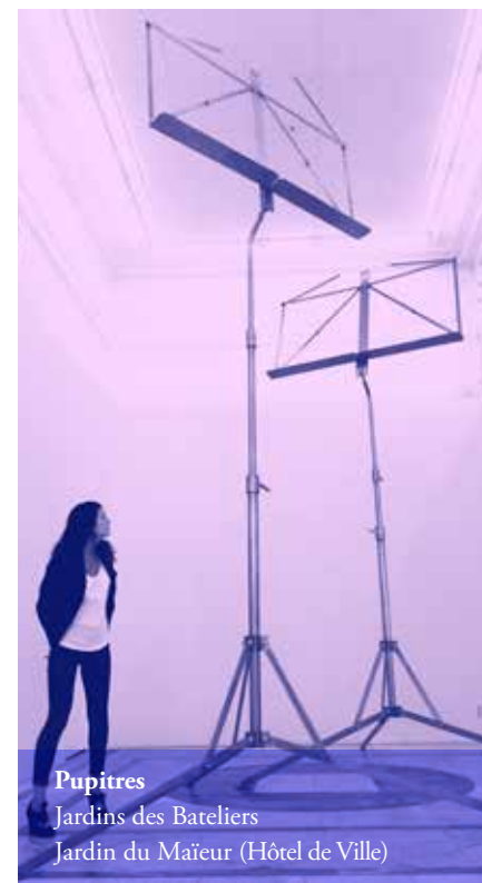
Pupitres Jardins des Bateliers Jardin du Maître (Hôtel de Ville)