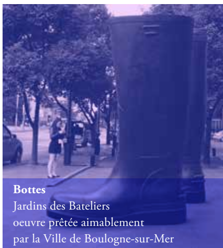
Bottes Jardins des Bateliers oeuvre prêtée aimablement par la Ville de Boulogne-sur-Mer