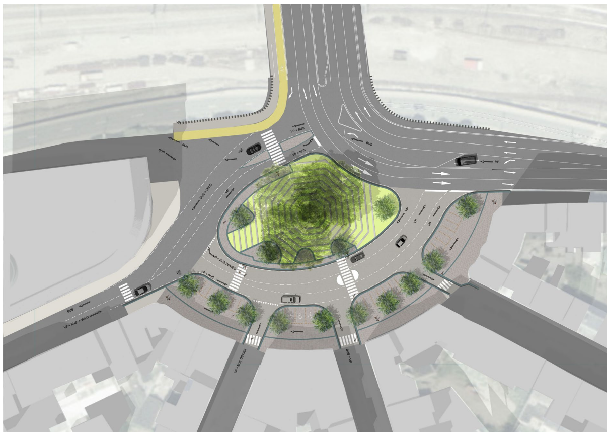
Réaménagement du rond-point Léopold en carrefour – Etude Skope, 2014

Pour rappel, ce projet est issu de l'étude portant sur le réaménagement des espaces publics du Nord de la Corbeille et consiste d'une part à réaménager le pont de Louvain et d'autre part à transformer le rond-point Léopold en carrefour à feux. La circulation de transit sera ainsi canalisée dans la partie Nord de l'actuel rond-point tandis que la circulation locale vers le centre-ville se fera dans la partie Sud, apaisant et fluidifiant ainsi la circulation. En outre, il s'agit également de prévoir le raccordement de la rampe de la future gare des bus avec le futur carrefour Léopold.