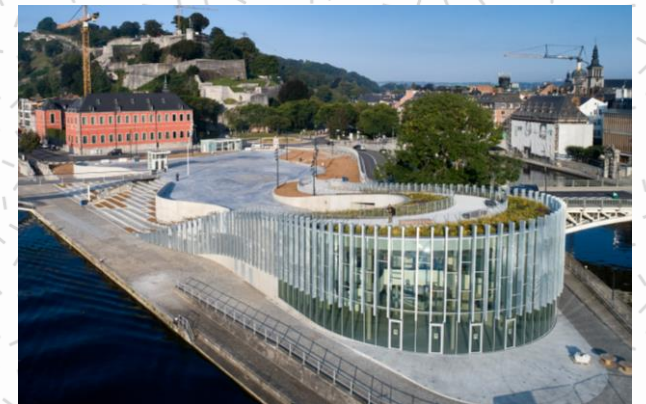
Le NID