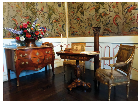
Salon aux toiles florales