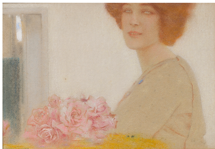
Fernand Khnopff, Des roses , 1912, pastel sur papier, 27 x 38,5 cm. Tournai, musée de Beaux-Arts. Propriété de l'Office national des musées de Belgique, inv. 1971 / n°386