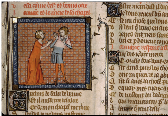
Jean De Meung et Guillaume De Lorris, Le Roman de la Rose, vers 1350-1360. Paris, Bibliothèque Sainte-Geneviève, Ms. 1126, fol. 106r (Bel Accueil remerciant l'amant pour sa couronne de roses)