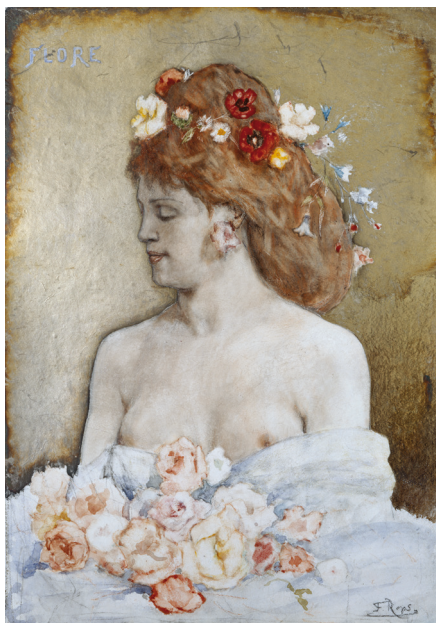
Félicien Rops, Flore , s.d., aquarelle sur carton et crayon de couleur sur fond doré, 23 x 16 cm. Otterlo, Kröller-Müller Museum, inv. KM 107.152