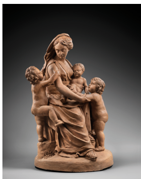
F. Roucourt, La Charité , 1794, terre cuite