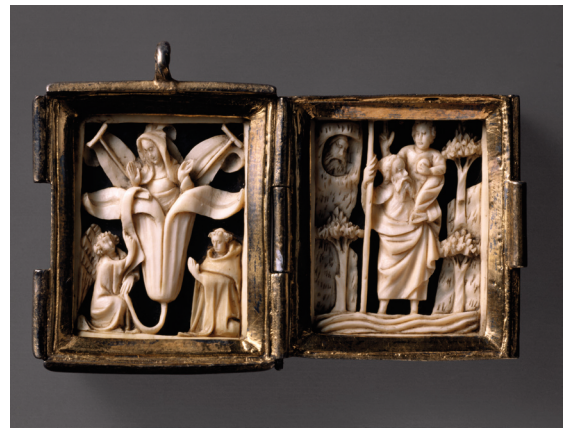
Pendentif en forme de diptyque, L'Annonciation , 1 ère ½ du 15 e siècle. Paris, Musée du Louvre, inv. OA52