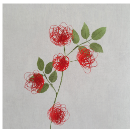
Laurence Aguerre, Petites Roses rouges , détail pour l'ornementation du Salon Louis XVI