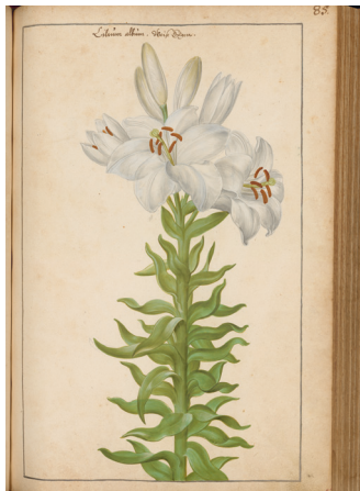
Lys, dans Florilegium artis naturam imitantis, 1630-1640. Namur, Bibliothèque universitaire Moretus Plantin, RMNC42, fol. 85