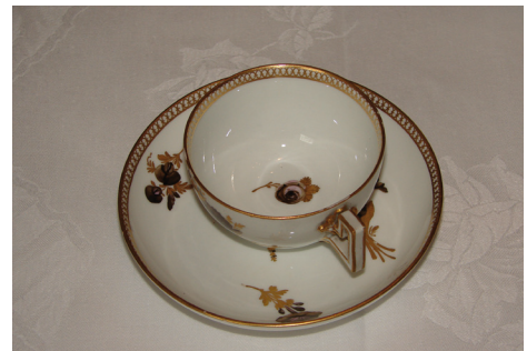
Service en porcelaine de Meissen, détail d'une tasse et d'une sous-tasse, 18 e s.