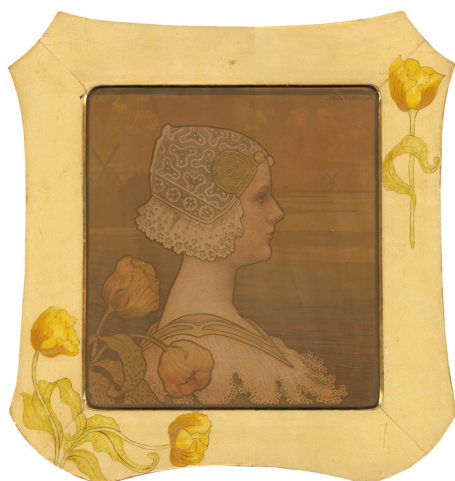
Paul Berthon, Sa très gracieuse Majesté la Reine Wilhelmine , c.1901, lithographie en couleur, 54,5 x 56 cm. Collection privée