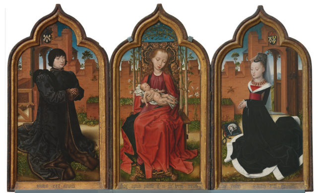
Maitre de 1473, Triptyque de Jan de Witte , 1473. Bruxelles, Musées royaux des Beaux-Arts de Belgique, Inv. 7007