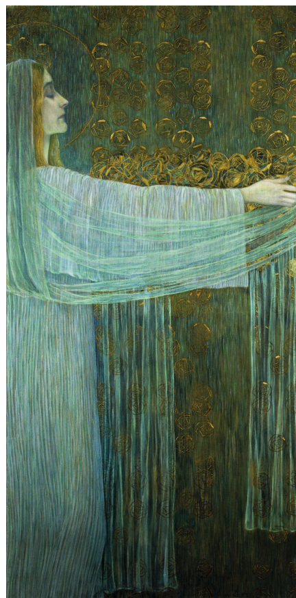
Wilhelm List, Le Miracle des roses , ca 1897, huile sur toile, 162 x 82 cm. Quimper, musée des Beaux-Arts, inv.75-27-1