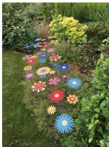
Ruth Moilliet, Pollination stems, meadow collection , installation dans le jardin dès le 1 er août © R. Moilliet