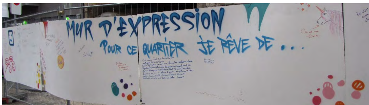
Quartier Carmes/Croiseurs - 2015

Un mur d'expression libre sera à disposition des habitants, commerçants et visiteurs, il leur permettra de donner une opinion sur leur espace de vie.