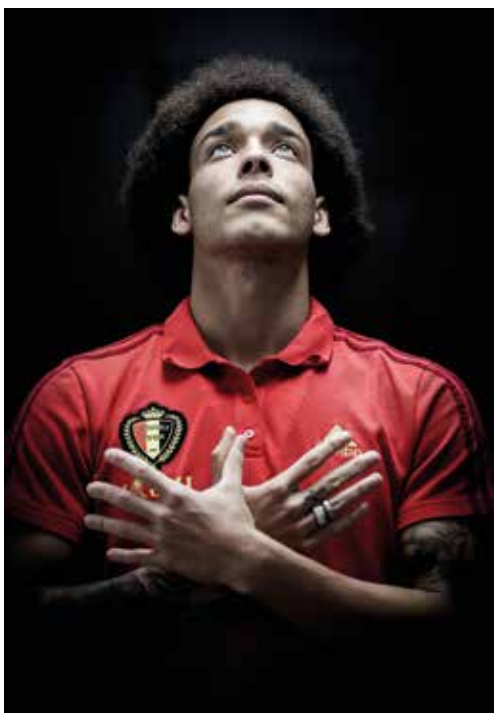
Le 25 Juin. Portrait d'Axel Witsel, réalisé pour Sport/Foot Magazine après une conférence de presse au centre d'entraînement de Dedovsk.