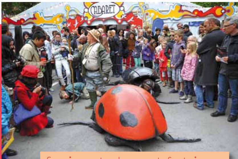
Sourires, tendresse et fantaisie

Pendant 4 jours, dans le décor somptueux de Namur, 350 artistes, comédiens et bateleurs, marchands de rêve et d'illusion, vous emmèneront pour quelques sous à la recherche de l'émotion et du vrai plaisir de la Fête !