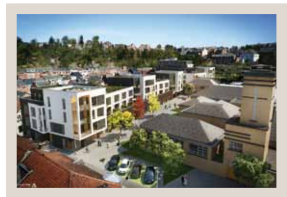
Les futurs logements, tels qu'ils ont été imaginés

Les Abattoirs, 73 rue Piret-Pauchet - 5000 Namur