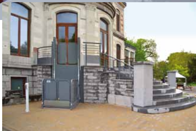
Les aménagements sont réalisés soit par le service Bâtiments de la Ville soit par entreprise extérieure avec un suivi par le Bureau d'Etudes Bâtiments ici le château d'Amée

Les projets développés concernent les aménagements en voirie, mais aussi les transports (taxis adaptés, lignes de bus accessibles), les événements culturels ou festifs, l'accessibilité des bâtiments publics ou encore des bureaux de vote.