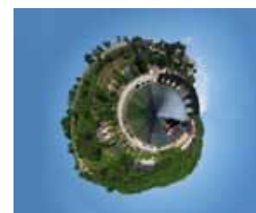
Couverture : Cederik Leeuwe