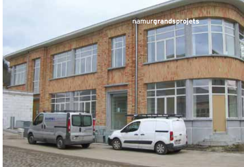
Vue globale du site, lors d'une visite de chantier fin janvier 2014

Le bâtiment central accueillera les ateliers créatifs du Centre Culturel Régional, un espace Horeca, des résidences d'artistes, une salle de diffusion, une salle de réunion et un hall d'exposition.