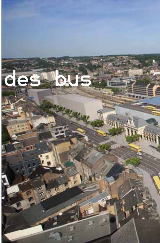
La gare des bus positionnée sur la dalle, au-dessus de la galerie actuelle, à l'arrière du bâtiment principal. Les bus y accéderont par un pont à haubans en acier (visible à droite de l'image), qui démarrera du square Léopold en longeant l'actuel parking et le magasin C&A.

Il fallait donc trouver une solution optimale, sans pour autant s'éloigner de la gare des trains afin de maintenir au mieux les correspondances entre les différents modes de transport. Plusieurs pistes ont alors été envisagées mais aucune n'était assez satisfaisante. Le terrain situé derrière la friterie de l'Avenir, par exemple, ne permettait pas d'accueillir un nombre de lignes suffisant.