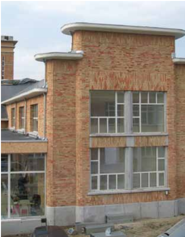
Vue globale du site, lors d'une visite de chantier fin janvier 2014

Un nouvel espace s'ouvre pour tous. Construits à partir de 1939, inaugurés en 1946, fermés en 1988, les Abattoirs de Namur revivent enfin.