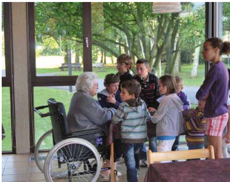
Ateliers intergénérationnels en maison de repos du CPAS

Sujet de société s'il en est, le vieillissement de la population - les personnes nées lors du baby-boom d'après-guerre ayant à présent dépassé l'âge de la pension - exige que les politiques sociales menées actuellement tiennent compte des besoins spécifiques des aînés, tant en matière d'infrastructures d'accueil qu'en services à domicile.