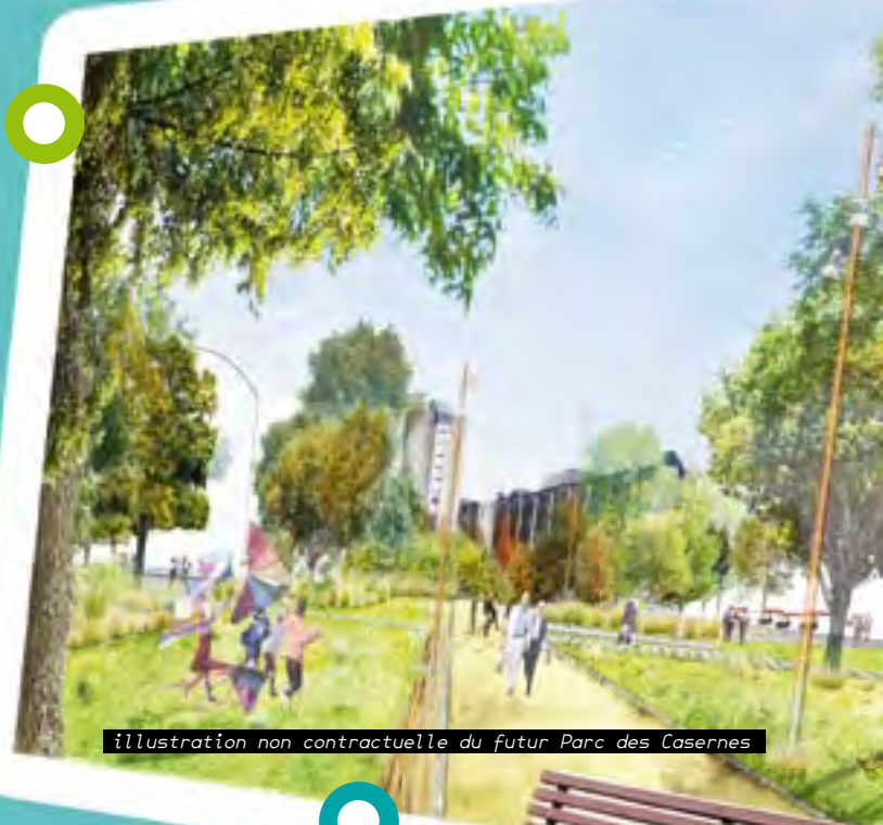
illustration non contractuelle du futur Parc des Casernes