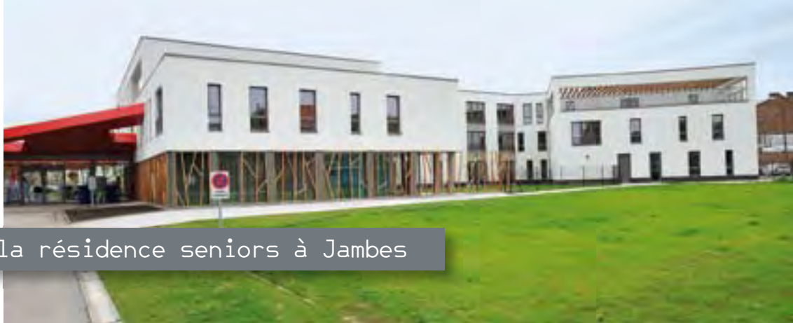
Ouverture de la résidence seniors à Jambes